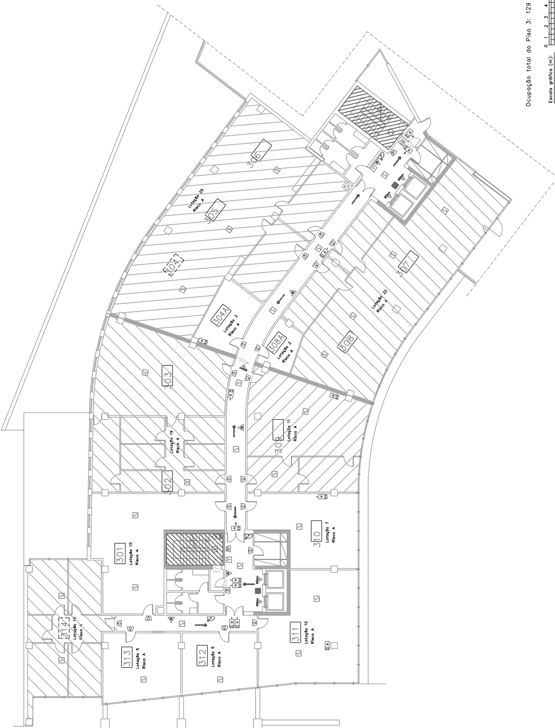
Ocupação total do Piso 3: 129 pessoas (Risco B)