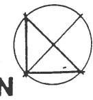
PLANTA DO PISO -1